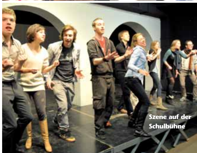
Szene auf der Schulbühne

In der „Vereinigung der Freunde des Maximiliansgymnasiums“ manifestiert sich die enge Verbundenheit vieler Schülerinnen und Schüler mit ihrer Schule weit über die Schulzeit hinaus. Diese Vereinigung von Ehemaligen und Förderern unseres Gymnasiums unterstützt seit Jahrzehnten die Schule in hohem Maße sowohl ideell wie materiell; insbesondere das Angebot einer offenen Ganztagschule, sowie die Neustrukturierung der Schulbibliothek beruht auf der finanziellen und organisatorischen Hilfe der Vereinigung.