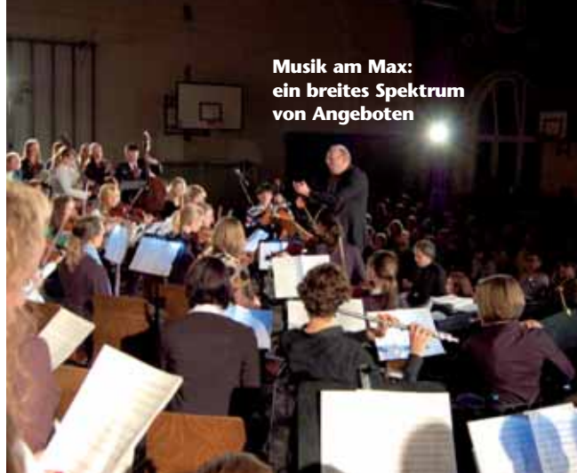
Musik am Max: ein breites Spektrum von Angeboten

Große Begeisterung herrscht stets bei den Darbietungen auf der schuleigenen Bühne. Ob es sich um Darbietungen der Schulspielgruppe der Mittelstufe oder um professionell und mit schauspielerischem Können dargebotene klassische und moderne Stücke des Oberstufenkurses „Dramatisches Gestalten“ handelt, Theaterspiel hat eine große Tradition am Max.