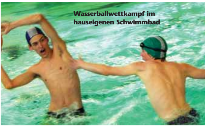
Wasserballwettkampf im hauseigenen Schwimmbad