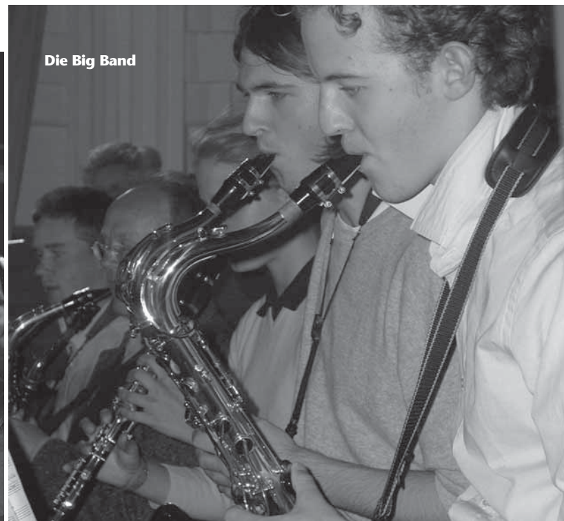
Die Big Band